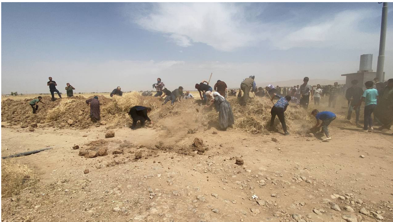
Frauen aus Maxmûr füllen die zuvor vom irakischen Militär ausgehobenen Gräben wieder.