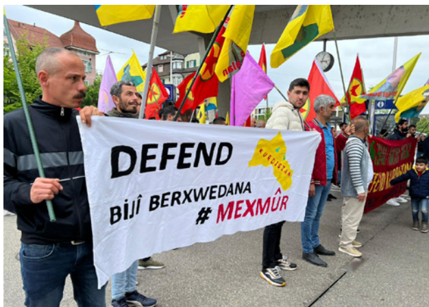
Protest in Solothurn gegen die Angriffe auf Mexmûr.