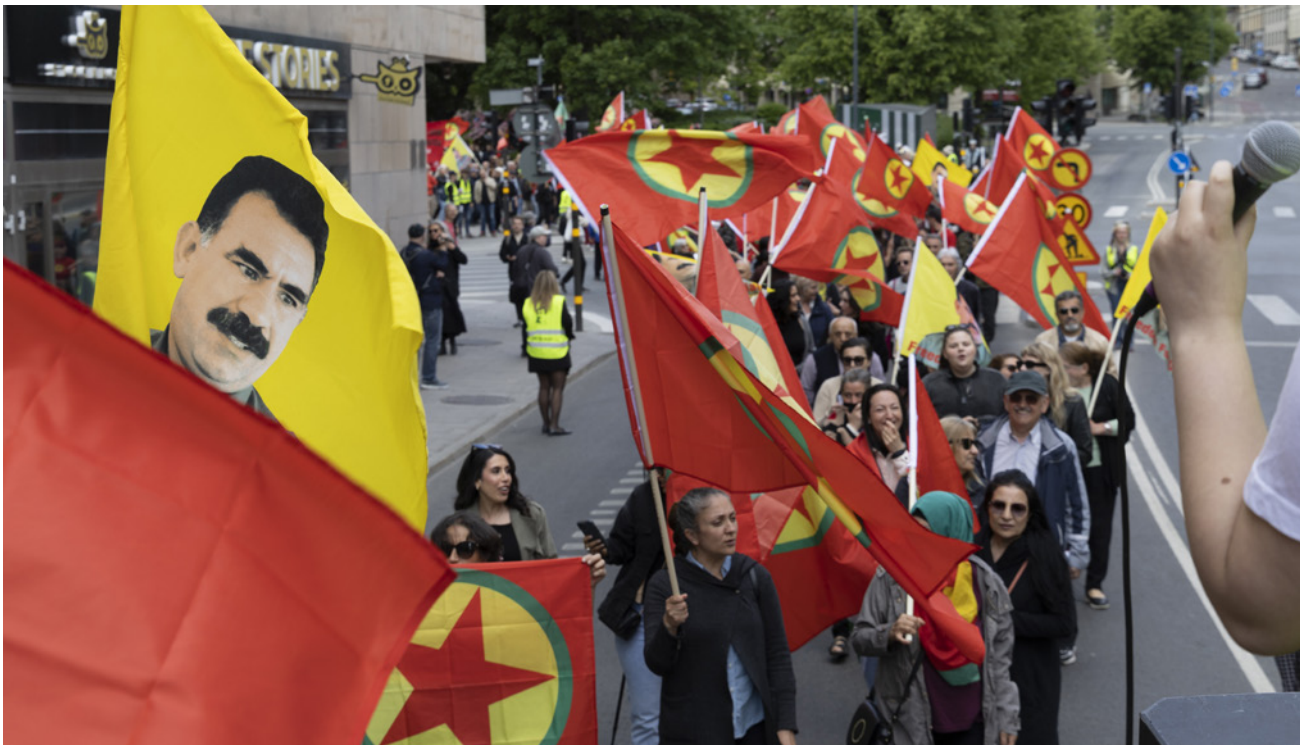
Unter dem Motto „Nein zur NATO, keine Erdoğan-Gesetze in Schweden“ haben am 4.6.2023 zahlreiche Menschen in Stockholm gegen die Einführung neuer Terrorgesetze und den geplanten NATO-Beitritt des nordischen Landes protestiert.