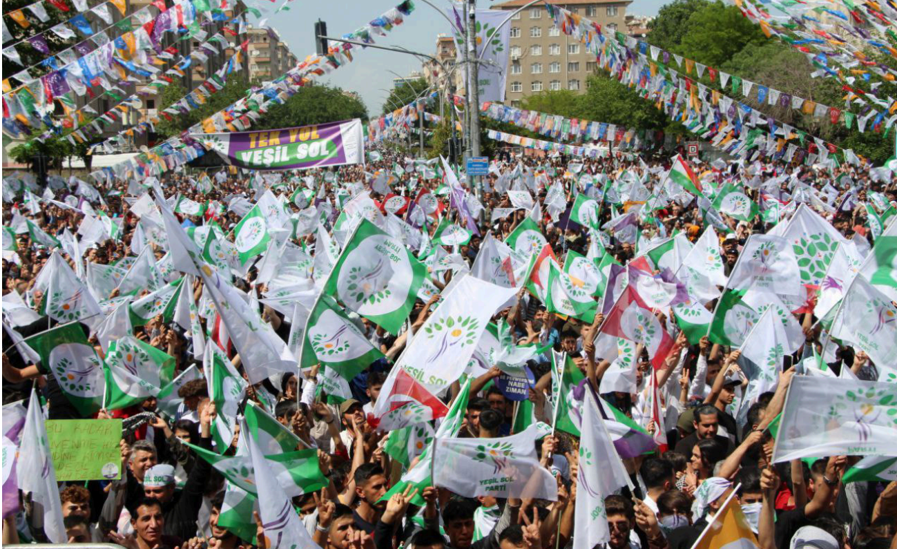
Trotz gut besuchter Wahlveranstaltungen – hier am 13. Mai 2023 in Amed (Diyarbakir) – konnte Erdoğan nicht abgewählt werden.

seine Wahlpropaganda) über den Justiz- und Sicherheitsapparat (für die Verfolgung der Opposition) bis hin zu den finanziellen Reserven des Landes (wie für das einmonatige Gratisgasgeschenk kurz vor der Wahl). Auch am Wahltag kam es zu zahlreichen Zwischenfällen und Unregelmäßigkeiten, über die wir in unserem Liveblog berichtet haben. Und dennoch stimmten 48 Prozent der Wähler:innen gegen eine weitere Amtszeit von Erdoğan.